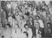
ΑΡΙΣΤΕΡΑ: Ὁ ἀρχηγὸς τῆς Φ.Δ.Ε. κ. Σοφ. Βενιζέλος, ὁμιλοῦν ἐπὶ τὴν κατάστασιν τῆς αἰθούσας τοῦ ἑορταστικοῦ θέατροῦ καὶ κατὰ τὴν συνέλευσιν, ΔΕΞΙΑ: Ἐπιτελείωται ἡ ὕλην τῶν περιγῶν τῆς ἐμέτης δύο τάξεων τοῦ συνεδρίου, ἑθνικῆς καὶ ἐπιλόγου καταστάσεως.

Ἐξελέγη διὰ ψηφοφορίας τὸ πολιτικὸν συμβούλιον