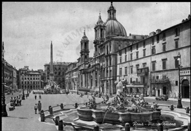
Roma - Piazza Navona