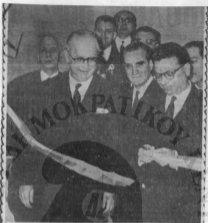
Οι υπουργοί Βουλγαρίας, Γαλλίας, Ολλανδίας, Γερμανίας, Ιταλίας, Σουηδίας, Τουρκίας, Βελγίου, της Ομοσπονδίας της Γερμανίας, Αυστραλίας, Ηνωμένων Πολιτειών, Βρετανίας, και άλλων της ΝΑ Ασίας.