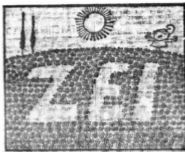
—«Ὁ λαὸς πορ λαο, γίνετο πορ σποσια»— 197 21