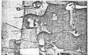
Ο ΣΥΡΟΣ ΜΟΥΣΤΑΚΛΗΣ (αριστερά), ο ΚΑΡΑΥΙΤΣΗΣ (κέντρο) και ο ΣΥΡΟΣ ΜΟΥΣΤΑΚΛΗΣ (δεξιά).